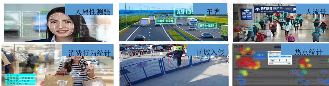
(智慧城市应用场景示例)