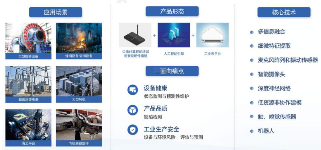
(工业物联网应用场示例)